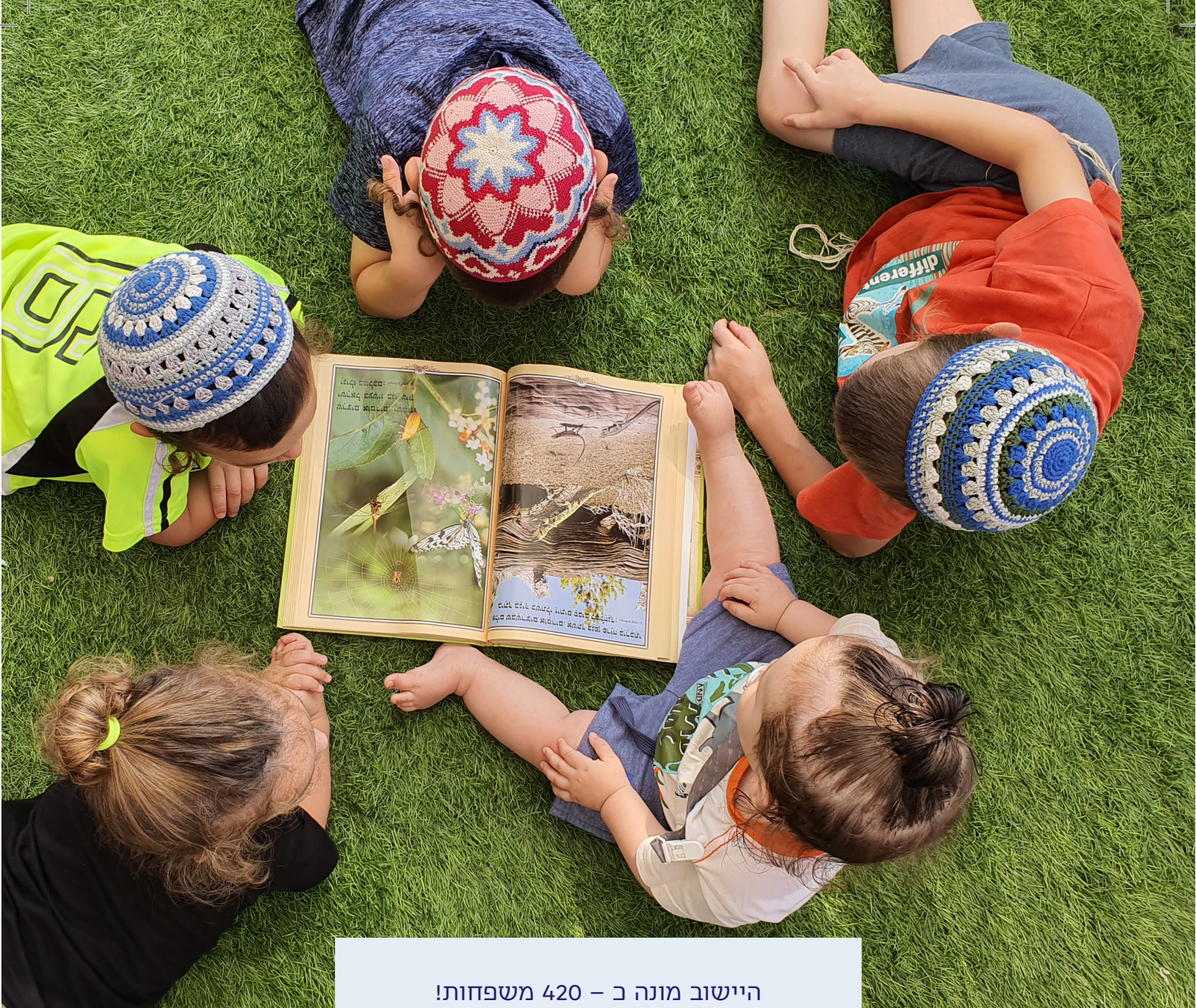
היישוב מונה כ - 420 משפחות!